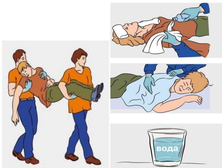
Рисунок 1 – Оказание первой помощи пострадавшему при тепловом ударе